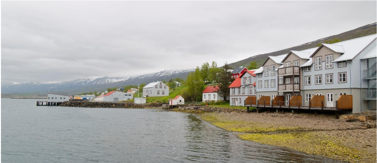
Zicht op het hotel, in een vorig leven het Frans hospitaal.