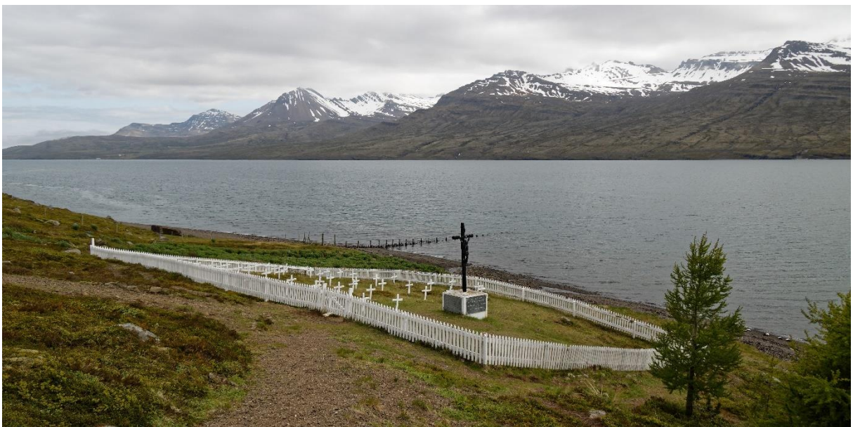
De begraafplaats in Fáskrúðfjörður.