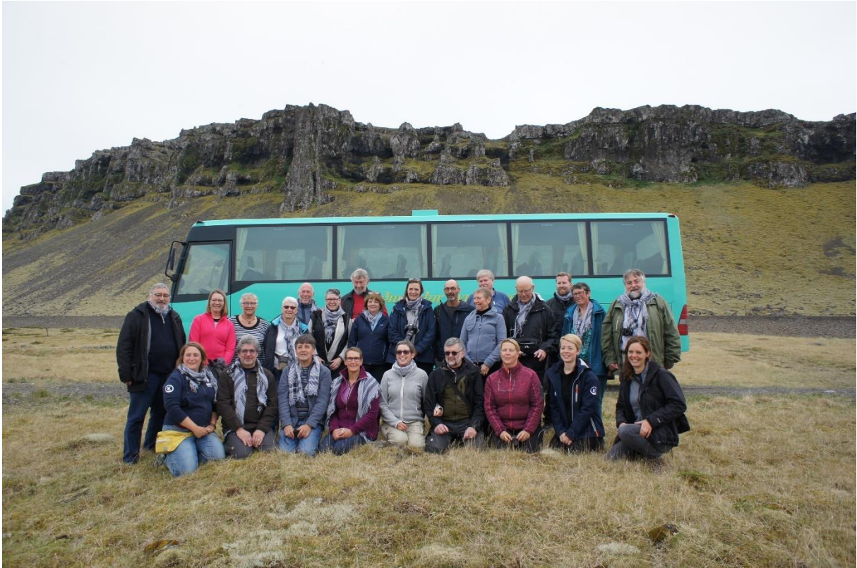
Tijd voor een groepsfoto, voor de groene bus.