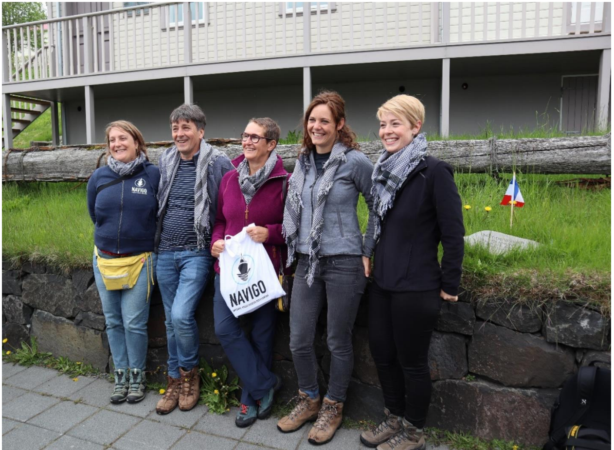
Poseren met onze visserssjaals voor de kapel in Fáskrúðfjörður.