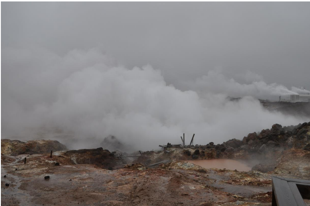
Gunnhver, een hetebronnengebied met vele zwavelbronnen en pruttelende modderpoelen.