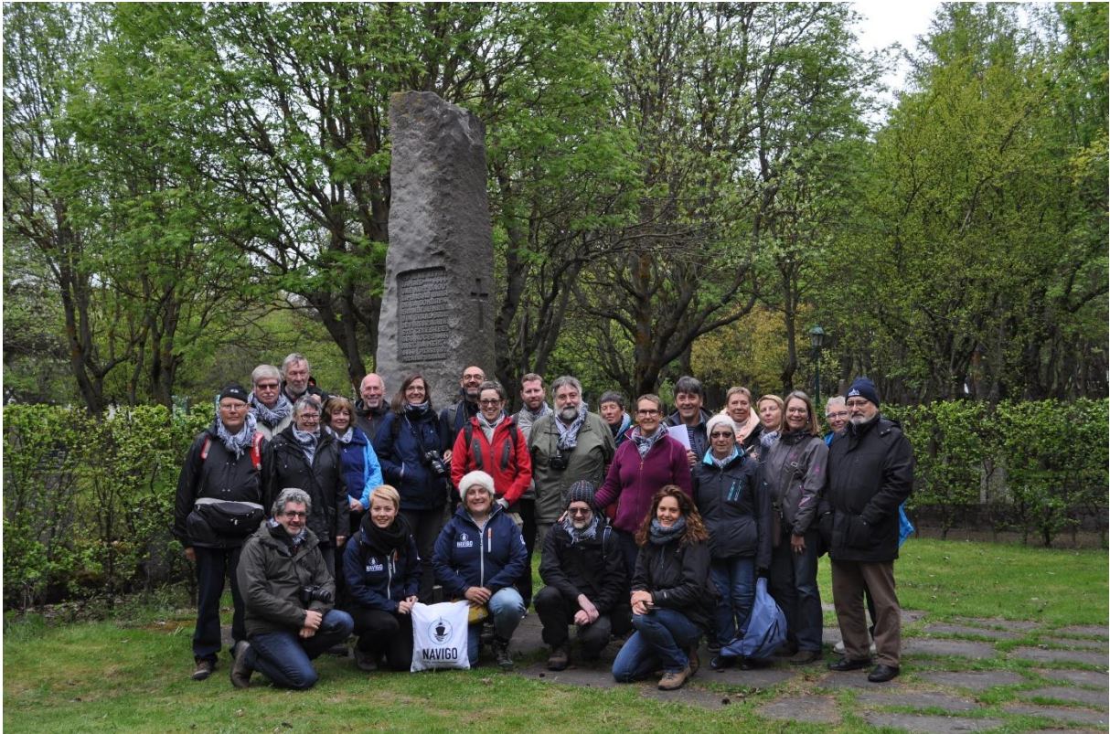
Groepsfoto op de begraafplaats Hólavallagarður in Reykjavík, bij de gedenkzuil voor de Franse IJslandvaarders, met opschriften van de Franse romancier Pierre Loti.