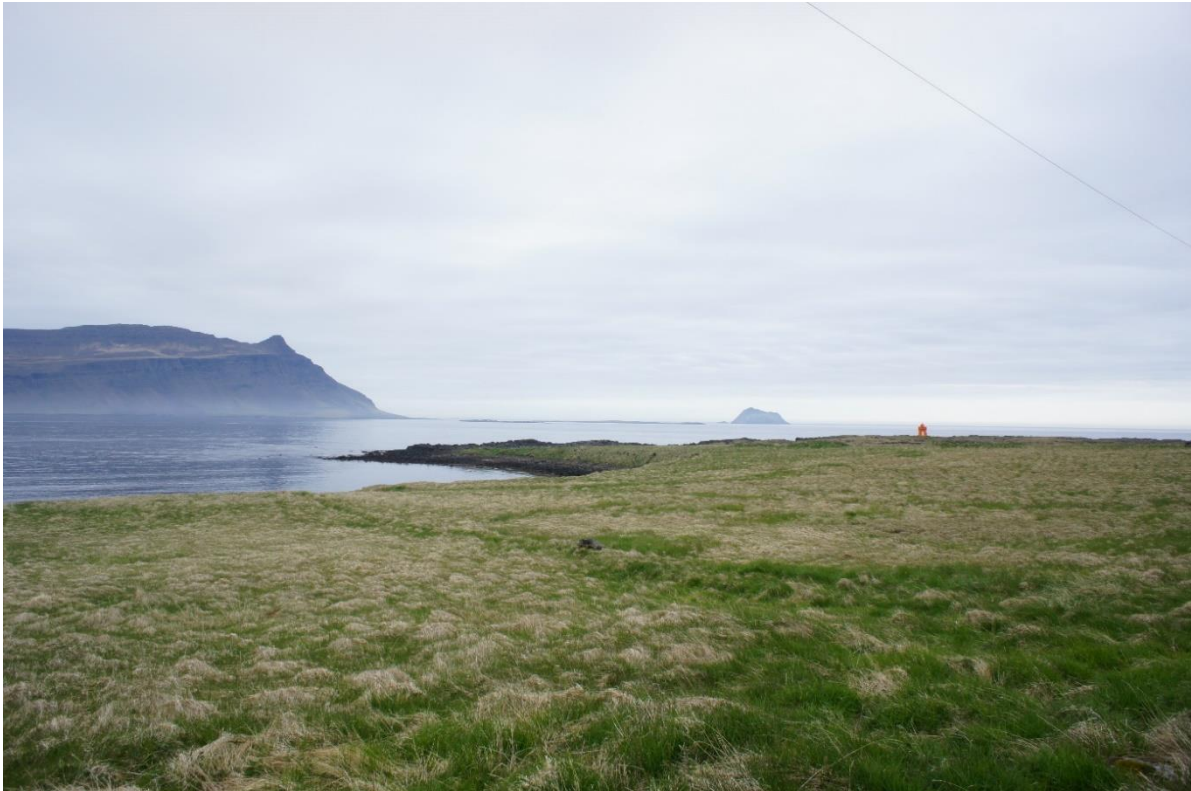
Zicht op de ingang van de fjord van Fáskrúðfjörður, met de 'Hooivumme' in de verte.