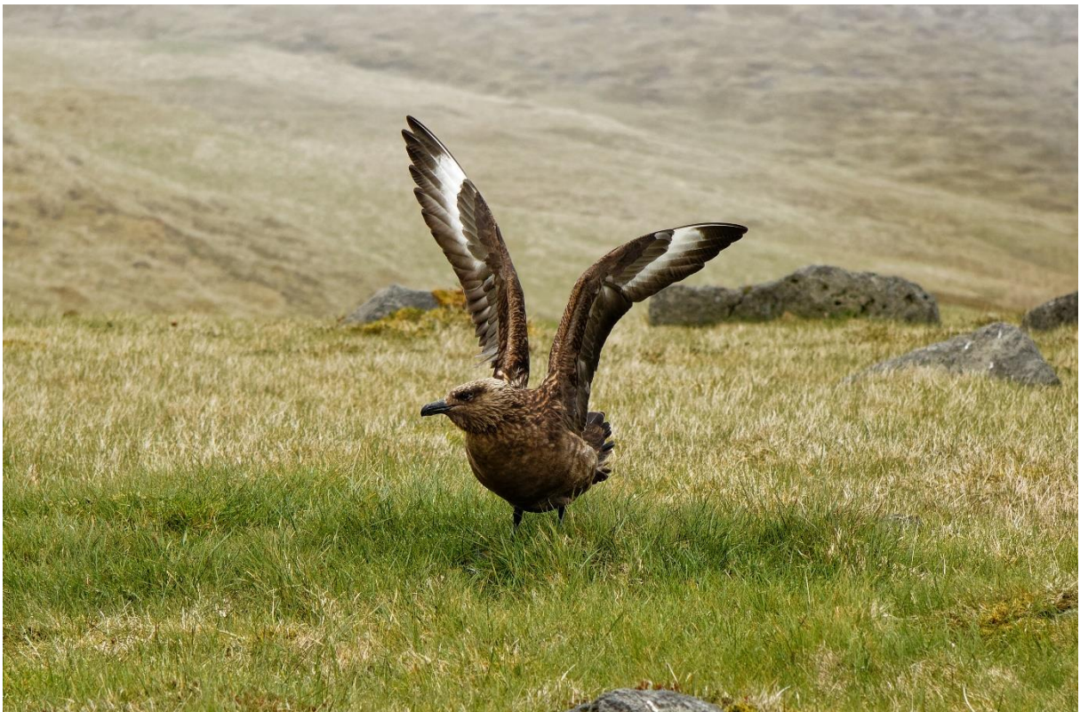
Puffins en grote jagers spotten op Ingólfshöfði.