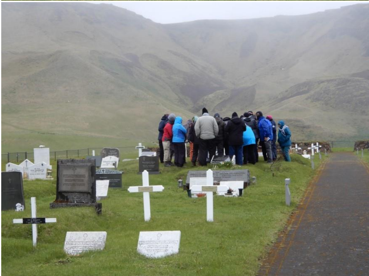
Beklijvend huldemoment voor onze Vlaamse IJslandvaarders begraven in Vik.