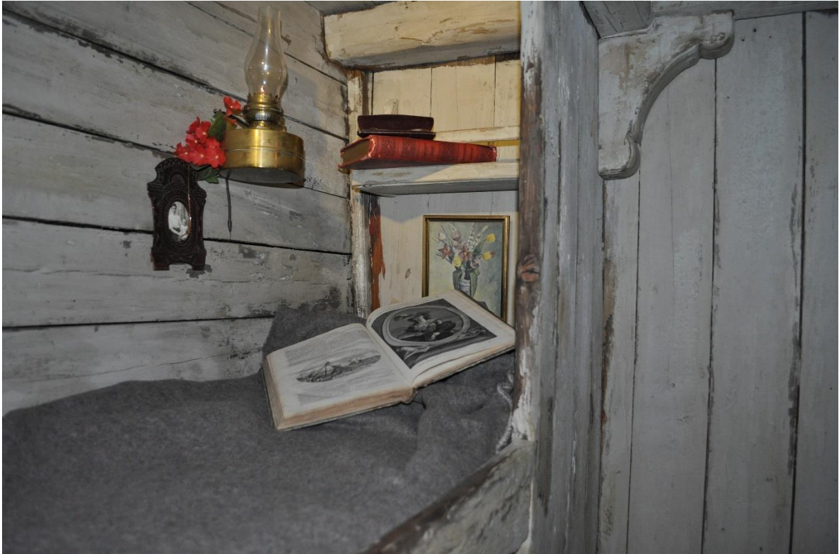
Enkele details van de opstelling in het kelderverdiep van het museum, waar het leven op de galette in beeld gebracht wordt.