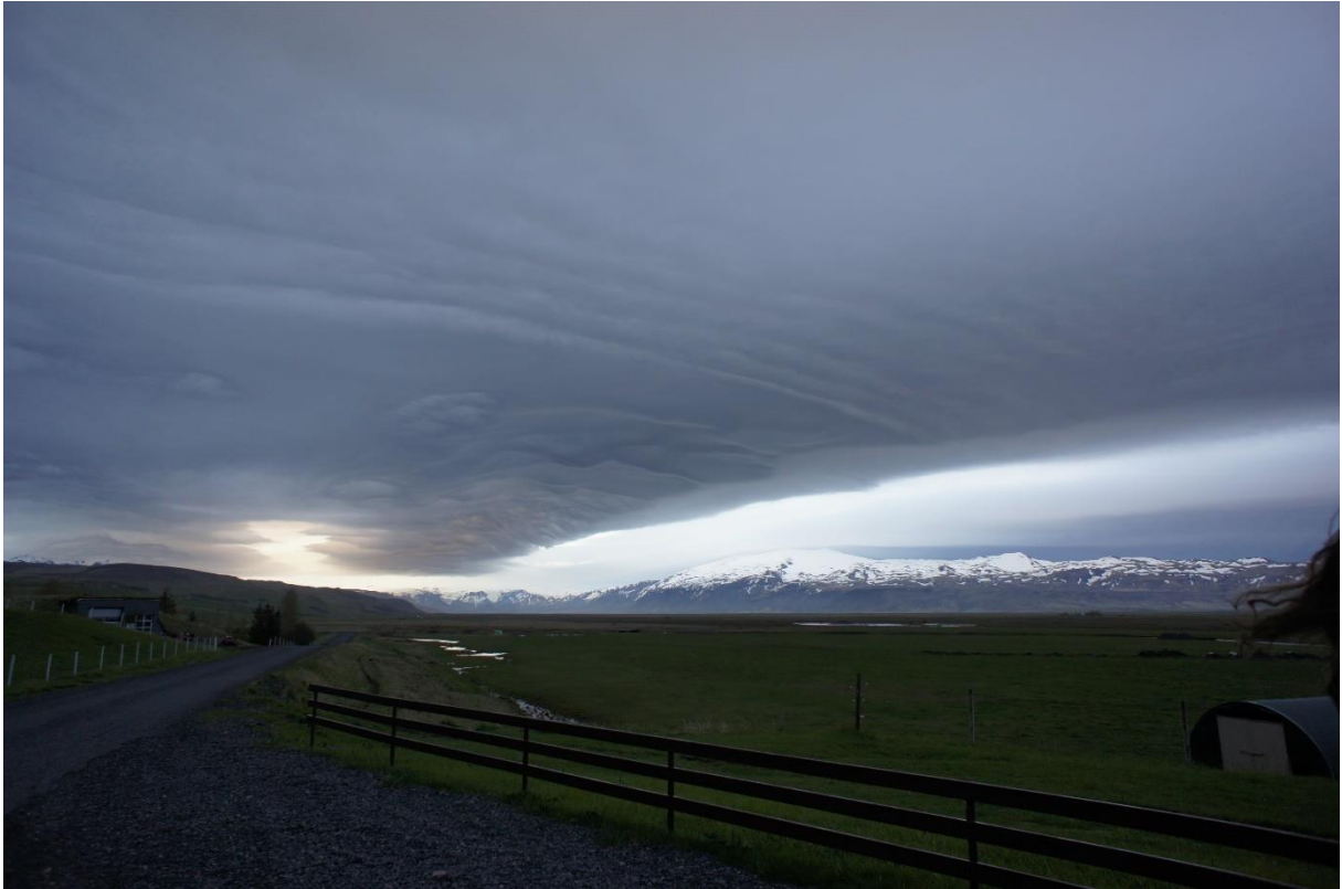
Eén van meerdere fascinerende wolkformaties die tijdens de reis verschenen aan de IJslandse hemel. Zichtbaar op de achtergrond: de wereldberoemde vulkaan 'Eyjafjallajökull'.