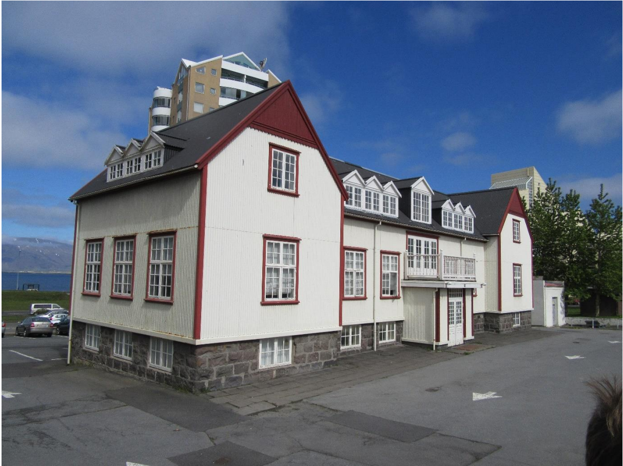
Het Frans hospitaal voor IJslandvaarders in Reykjavik.