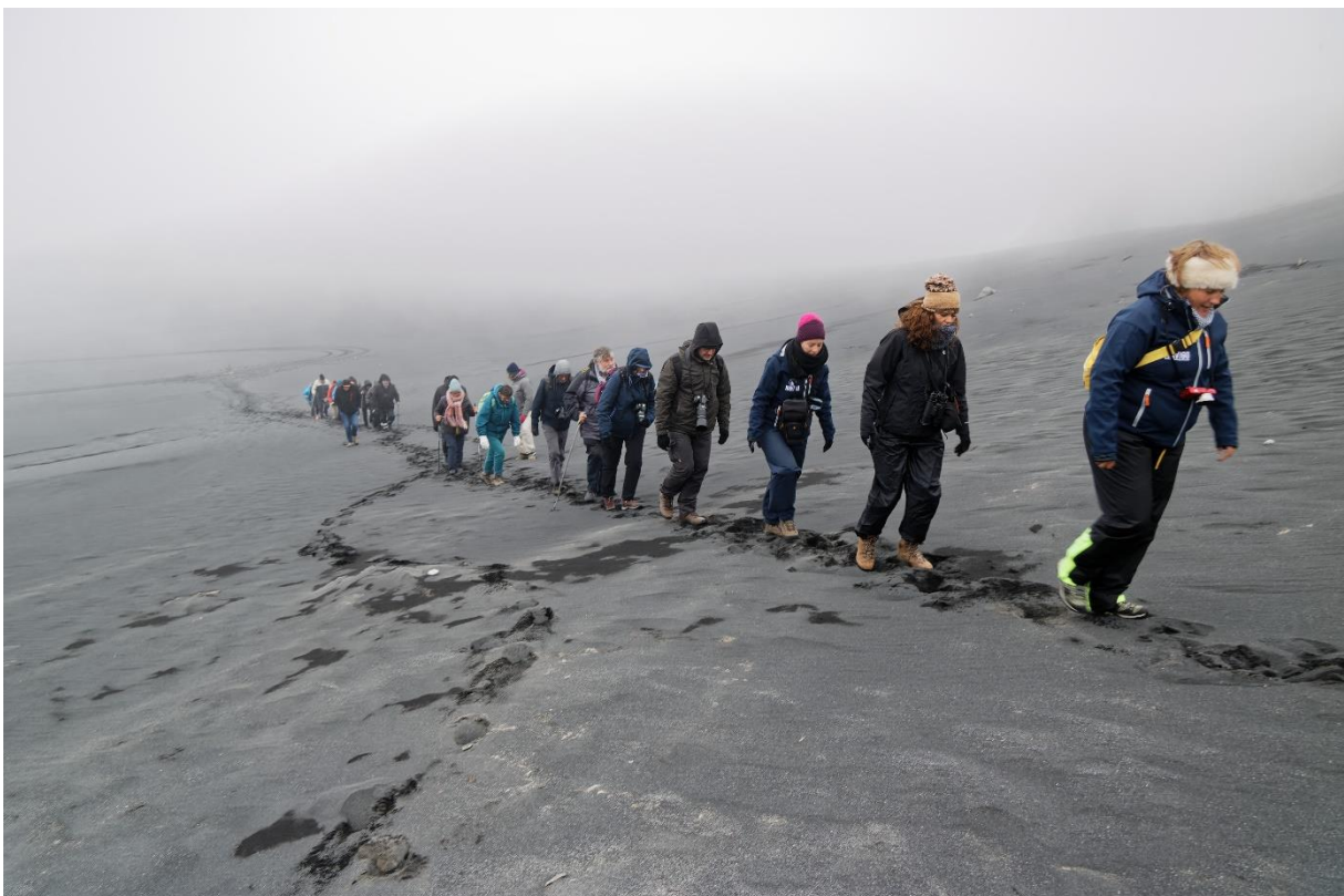
Tractortocht doorheen de spoelzandvlakte en de beklimming van de Hoge Blekker van IJsland, het 'Iengels hoofd'.