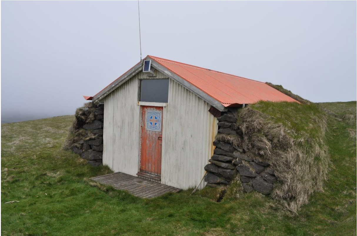
De schuilhut die sinds 1912 uitgerust wordt voor zeelui die zouden stranden op de kust.