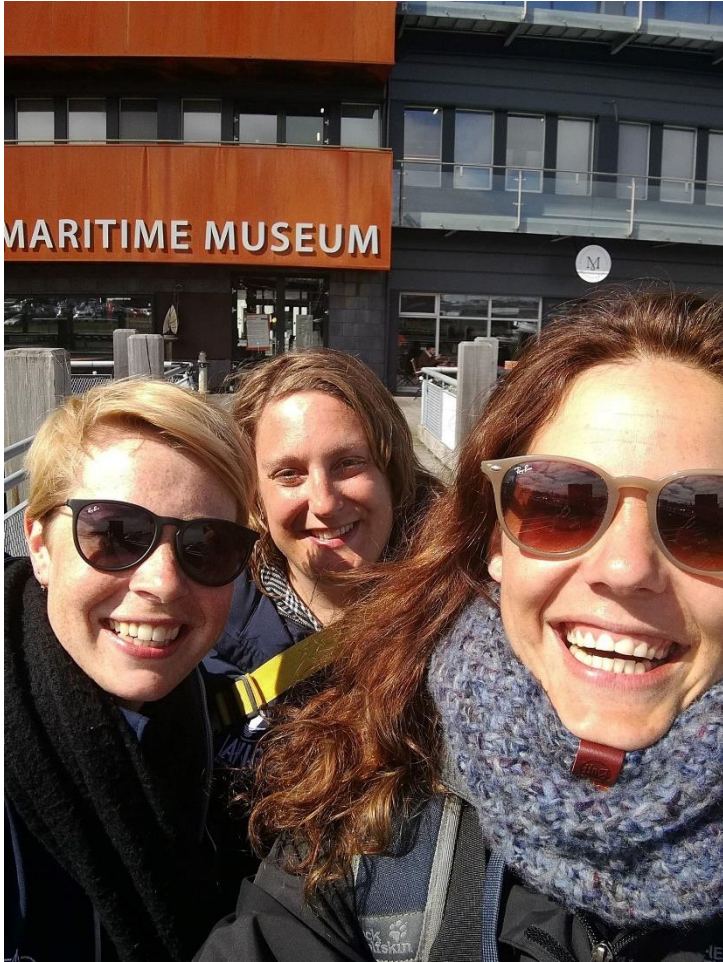
Het Maritiem Museum van Reykjavik, dat helaas gesloten was tijdens ons bezoek aan de IJslandse hoofdstad.