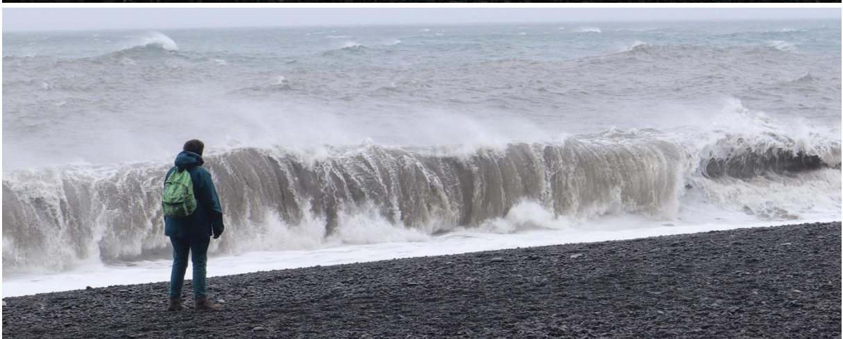
...naar wind, regen en koude op de zandstranden van Reynisfjara. De pieken op de bovenste foto zijn de zogenaamde 'Capucientjes'.