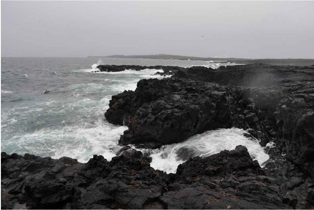
De zee slaat woest op de kliffen van het schiereiland Reykjanes.

Kennismaking met de ruwe natuur van IJsland