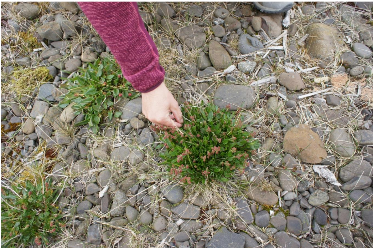
Schapenzuring, één van de IJslandse planten die onze vissers verzamelden omwille van de geneeskrachtige werking.