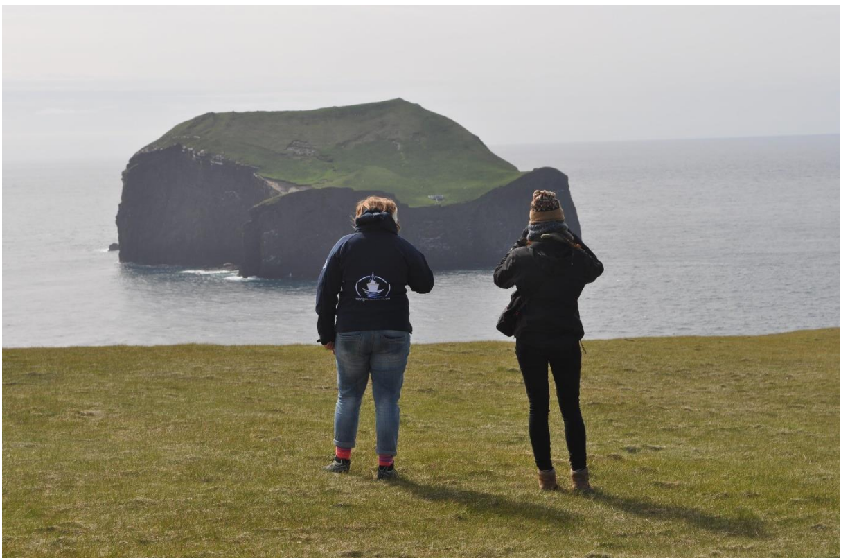
Uitkijken over enkele van de Westmaneilanden, een drukbezochte visgrond door onze IJslandvaarders.