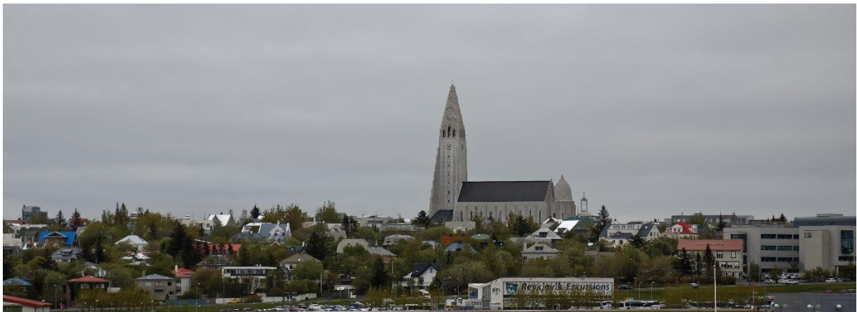
Uitzicht op Reykjavik, met centraal de Lutherse kerk "Hallgrímskirkja".