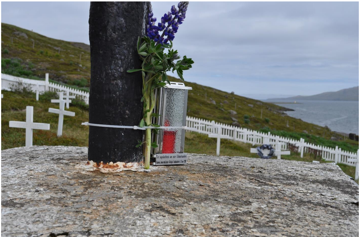
Een visserssjaal en lantaarn namens het gemeentebestuur Koksijde-Oostduinkerke brengen hulde aan onze Vlaamse IJslandvaarders.