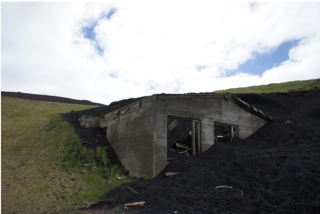
Zicht op het vulkanologische museum 'Eldheimar' op Heimaey.