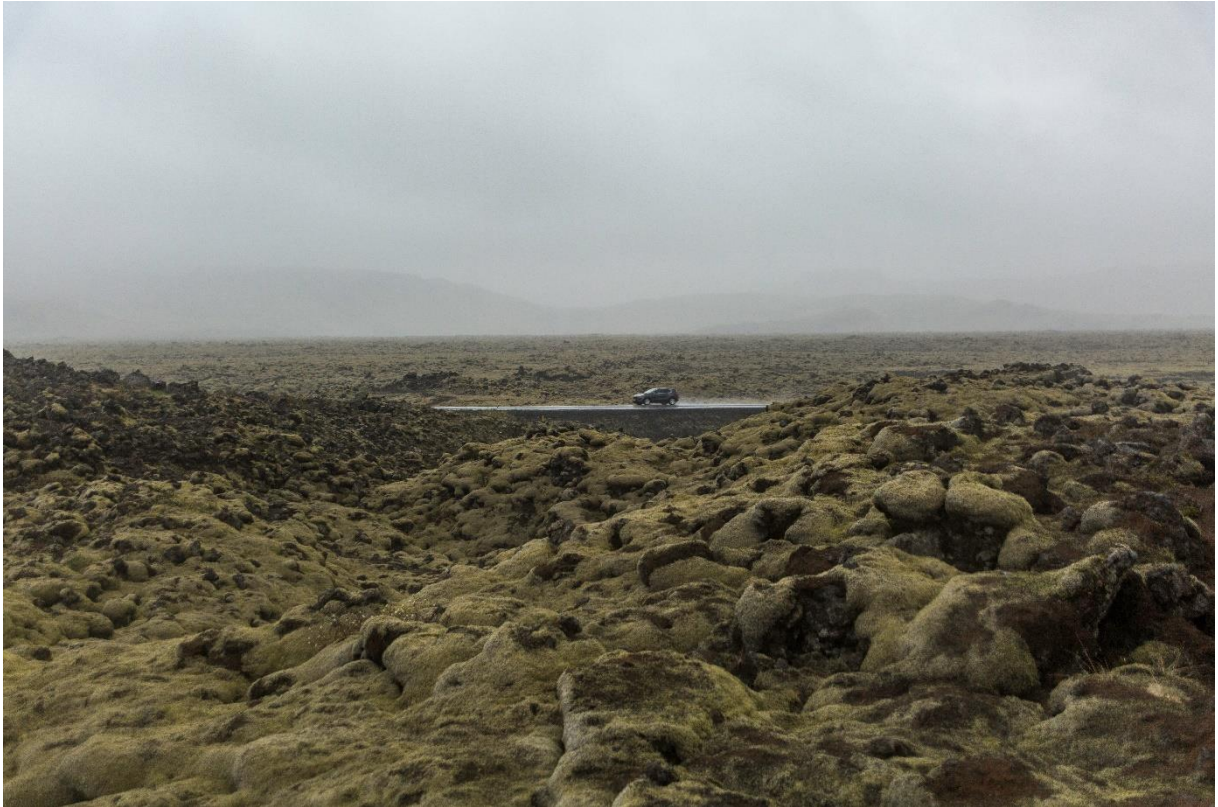
Het bevreemdende lavalandschap van IJsland.