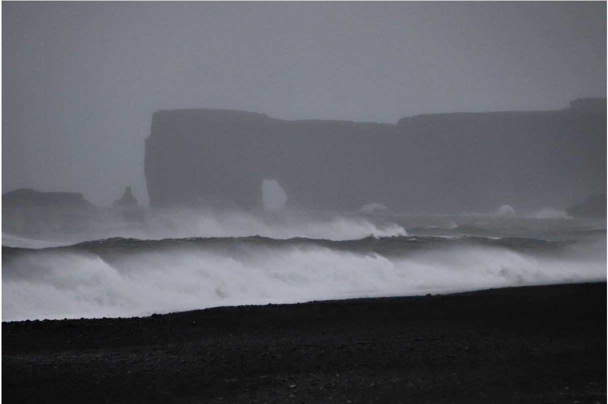
Zicht op kaap Dyrhólaey met het zogenaamde 'Poortje'.