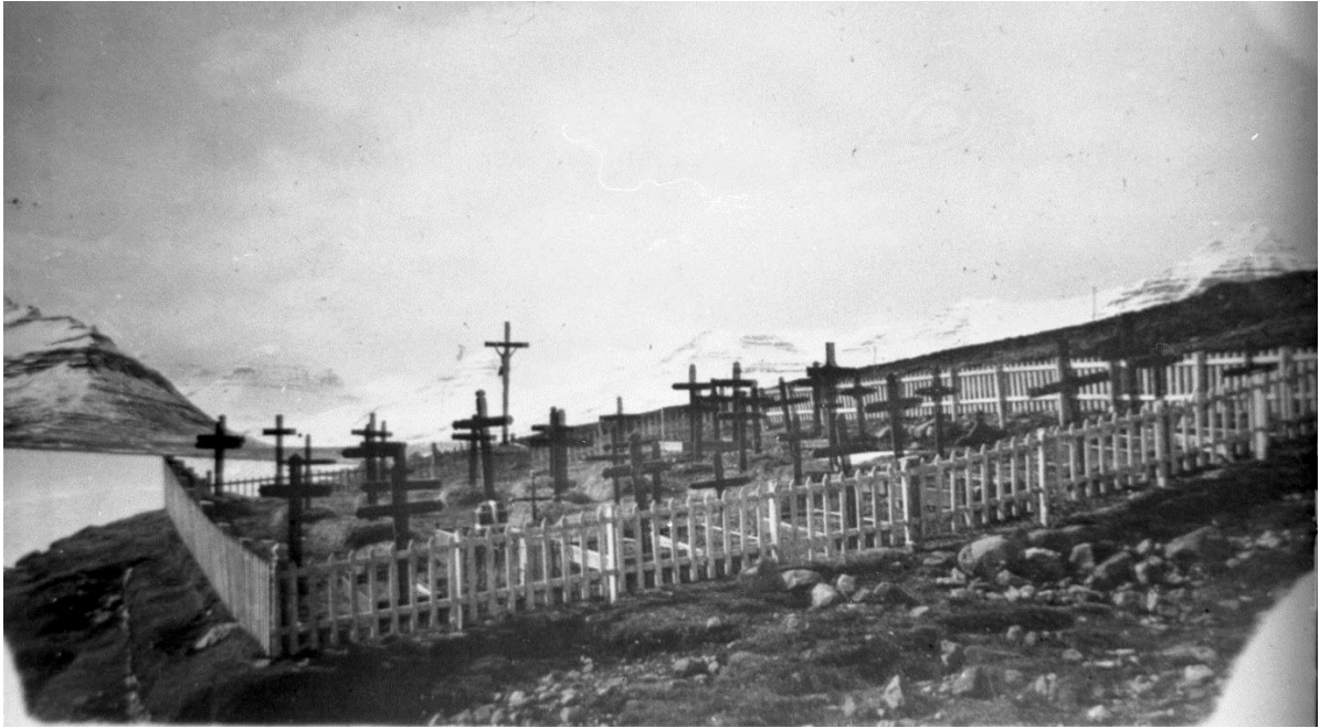
Begraafplaats voor matrozen en vissers op Franse schepen te Faskrudsfjord anno 1908