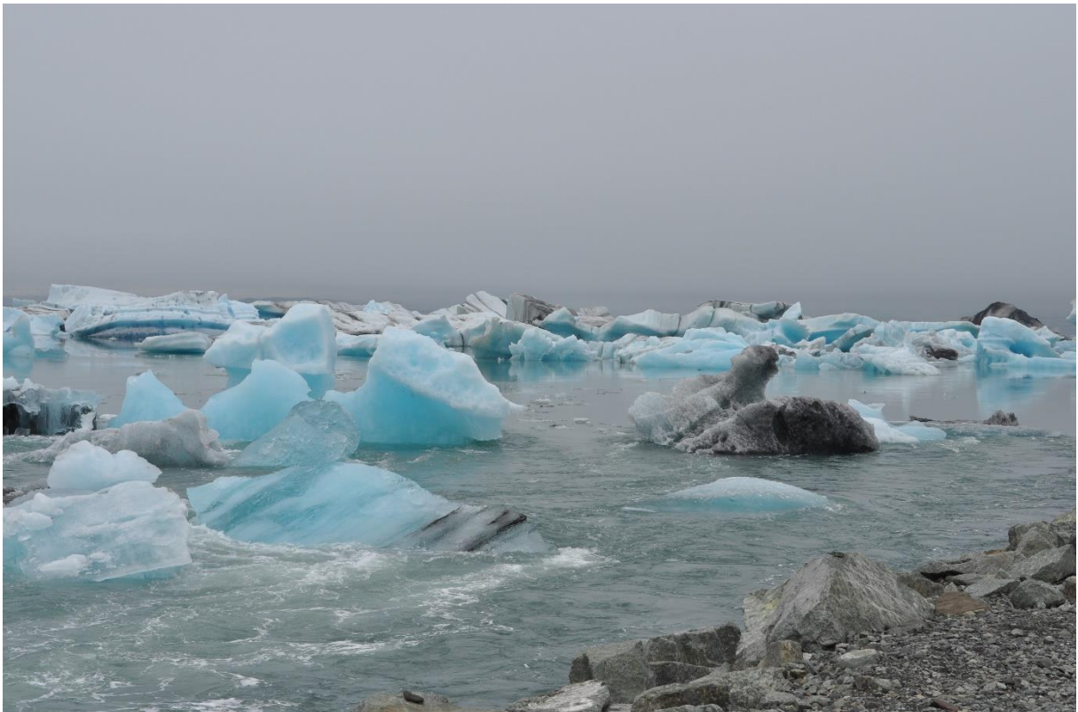
Het gletsjermeer Jökulsárlon.