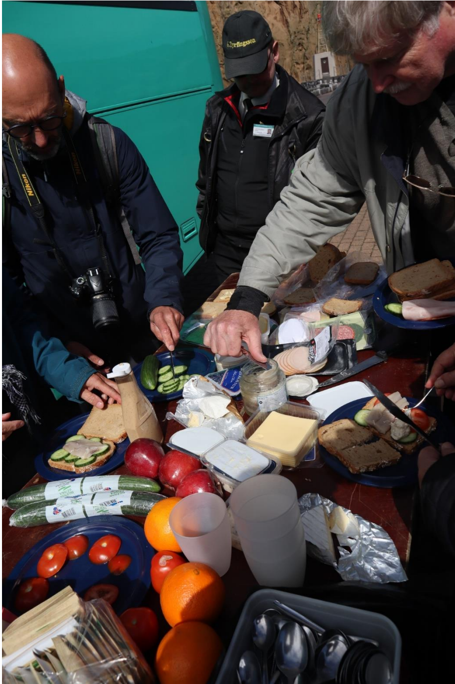
Lunch nabij de haven van Heimaey, met zicht op een oude vissersboot op het droge en natuurpracht.